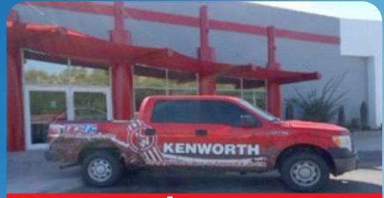
ATENCIÓN A MINAS